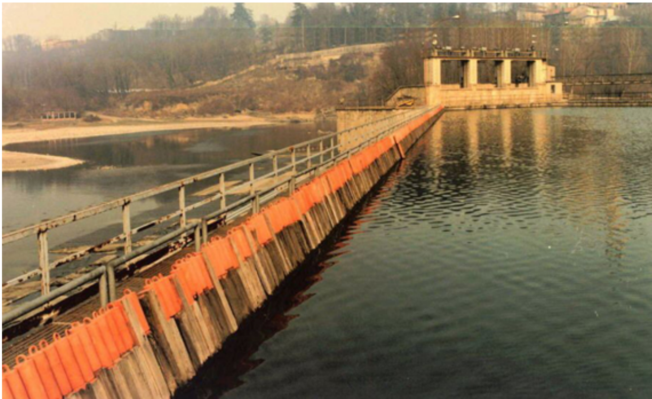
Fig. 1 Diga Poiree – Trezzo sull'Adda

Autori: Ing. Franco Robotti, Ing. Ivan Cottone – AGISCO srl