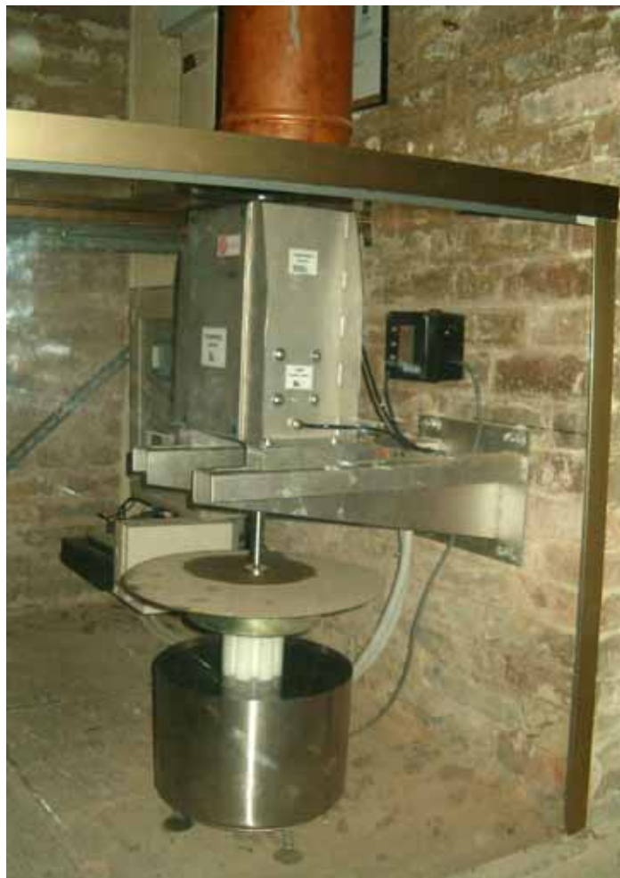
Figura 6: telecoordinometro PLUS

Esso combina il grande vantaggio economico (il costo risulta meno della metà dei corrispondenti prodotti presenti sul mercato) con un'elevata precisione di misura, affidabilità di funzionamento e robustezza. Le dimensioni ridotte gli permettono di essere montato con facilità anche in spazi ristretti e di difficile accesso.