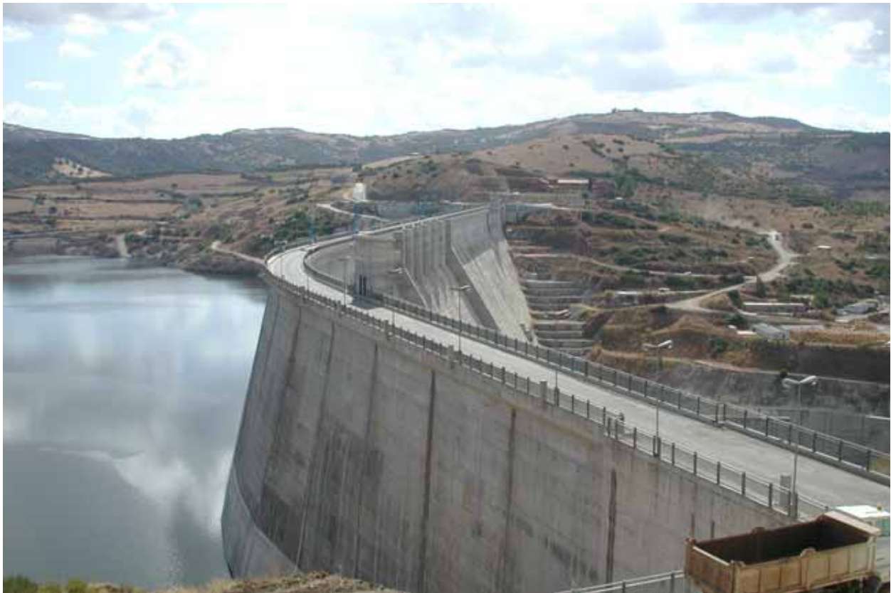
Figura 1: Diga Cantoniera sul fiume Tisro

Le apparecchiature di misura impiegate sono di molteplici tipologie ed idonee a registrare differenti caratteristiche della struttura. In funzione della dimensione dello sbarramento e della complessità della struttura viene installato un adeguato sistema di controllo in grado di fornire un quadro significativo dell'andamento della diga.